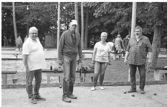
Die Finalisten zu Spielbeginn – vor dem Sturzregen – aus Rottweil, Villingen und Nidereschach