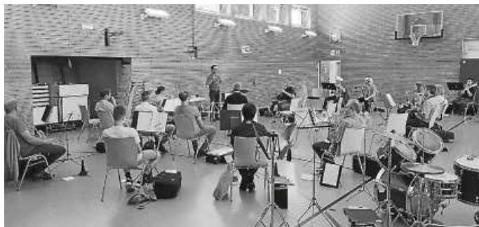
Erste Probe in der Turn- und Festhalle

Nach vielen Monaten der Enthaltensamkeit darf der Musikverein Flözlingen nun endlich wieder proben. Die Vorfriede war bei allen groß – da konnte auch das Regenwetter derzeit nichts ändern. Es ist schön, dass wir Musiker und Musikerinnen nun wieder gemeinsam musizieren dürfen.