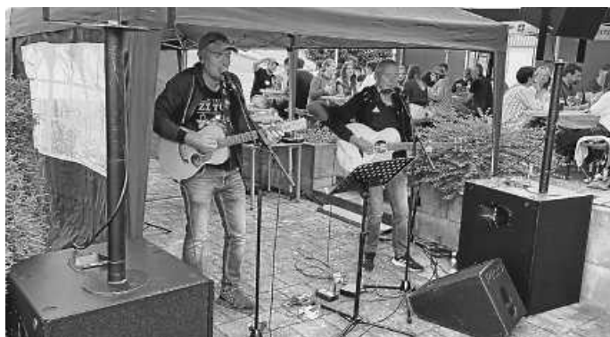
Toller Auftritt von Figa & Schuss