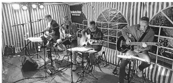
The Wotcha Blokes LIVE