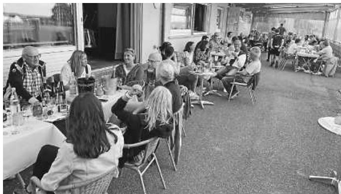
120 Gäste beim SVZ