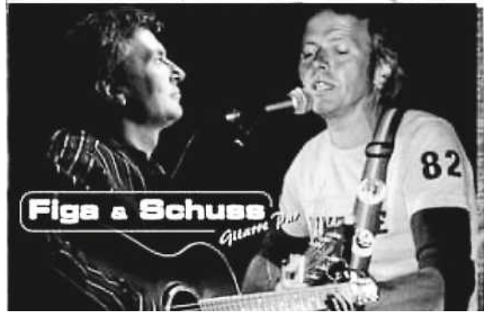
Live-Konzert beim SVZ